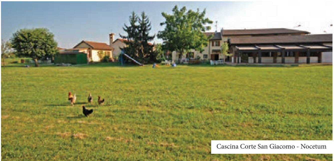
Cascina Corte San Giacomo - Nocetum