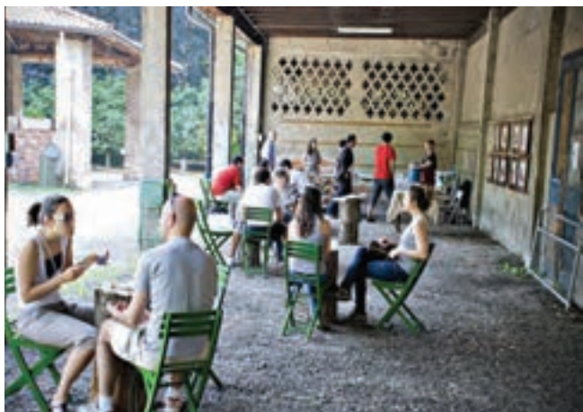
Cascina Molino San Gregorio

limentazione, negli anni recenti a queste vocazione si è aggiunta quella sociale e culturale che si è sviluppata - a volte anche in modo informale – intrecciandosi con quella originaria oppure sostituendola. Molte cascine milanesi sono state infatti recuperate e tenute in vita da soggetti del terzo settore e associazioni di cittadini che al loro interno hanno trovato spazi disponibili e flessibili per ospitare attività socioculturali di diverso tipo e servizi per i cittadini: centri di accoglienza, comunità di alloggio e cura, centri sociali, spazi per la cultura, l'arte, la didattica e il tempo libero.