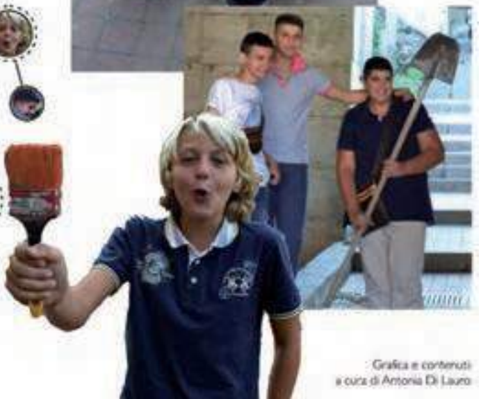
Grafica e contenuti a cura di Antonia Di Lauro